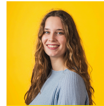
Mare Leegte adviseur onderwijs en kwaliteit