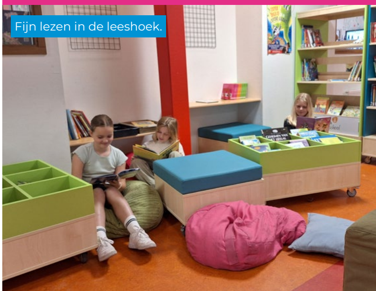
Fijn lezen in de leeshoek.

Op de website van KyK ( www.kykscholen.nl/documenten ) vind je een verzameling van belangrijke documenten die betrekking hebben op onze organisatie en onze dienstverlening. Van privacybeleid tot sociale media richtlijnen, meldcodes, reglementen en statuten, tot documenten van de GMR (Gemeenschappelijke Medezeggenschapsraad) en bestuursdocumenten. Deze documenten zijn essentieel om transparantie, naleving en goed bestuur te waarborgen binnen KyK.