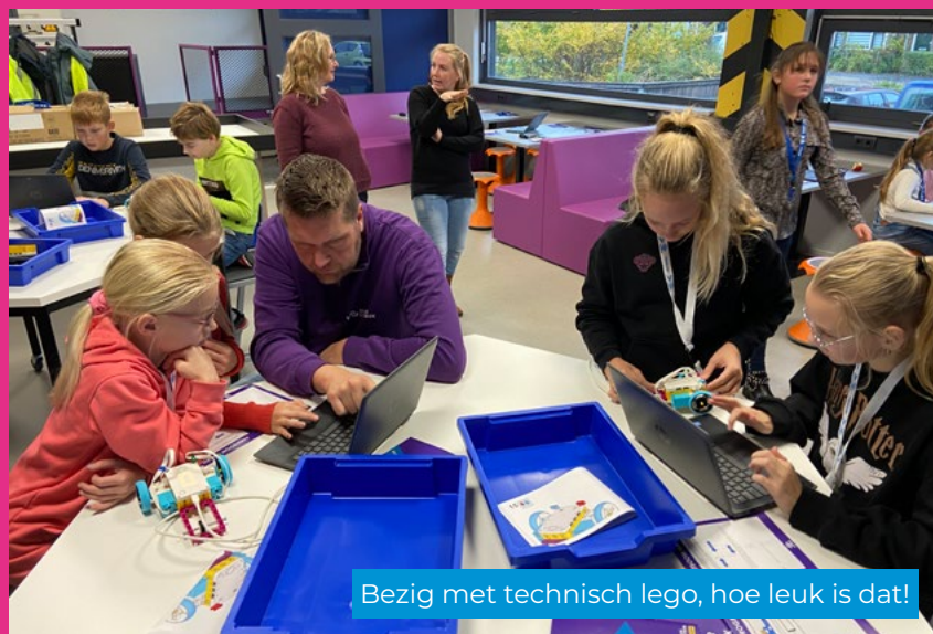
Bezig met technisch lego, hoe leuk is dat!

Op een openbaar ikc zijn alle kinderen en medewerkers welkom, ongeacht hun sociale, culturele of levensbeschouwelijke achtergrond. De openbare school leert kinderen van jongs af aan respect te hebben voor elkaars mening of overtuiging. Er wordt actief aandacht besteed aan de overeenkomsten en verschillen tussen kinderen, zonder voorkeur voor één bepaalde opvatting. De openbare school heeft aandacht voor en biedt ruimte aan ieder kind én iedere medewerker.