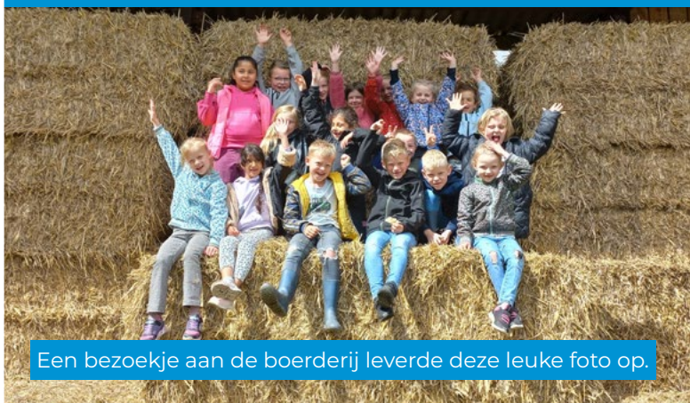
Een bezoekje aan de boerderij leverde deze leuke foto op.