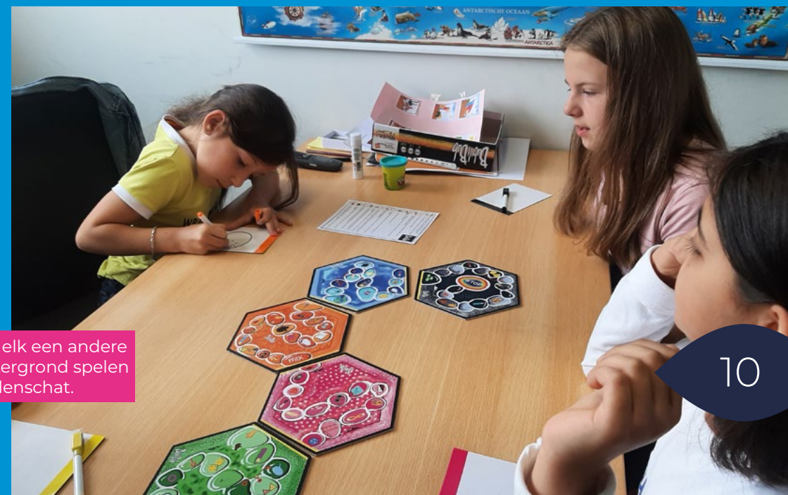
Leerlingen met elk een andere culturele achtergrond spelen samen Woordenschat.

Als er voldoende interesse is in vormingsonderwijs, kunnen wij deze lessen aanvragen voor de groepen 7 en 8. Daar zijn geen kosten aan verbonden voor u of voor de school.