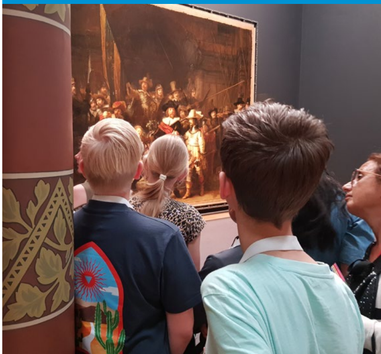
Groep 7 en 8 kijken aandachtig naar de Nachtwacht tijdens hun excursie naar het Rijksmuseum.

Na acht jaar basisonderwijs, gaan kinderen naar het voortgezet onderwijs. De school maakt een plaatsingsadvies VO op basis van de schoolresultaten en de persoonlijke talenten en eigenschappen van de leerlingen. Wij helpen leerlingen en hun ouders tijdig om een goede keuze te maken, onder andere door het organiseren van schoolkeuzegesprekken met ouders en leerlingen. Ouders melden hun kind aan bij een school voor voortgezet onderwijs.