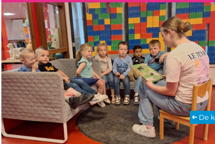
← De kleuters luisteren aandachtig naar het verhaal.