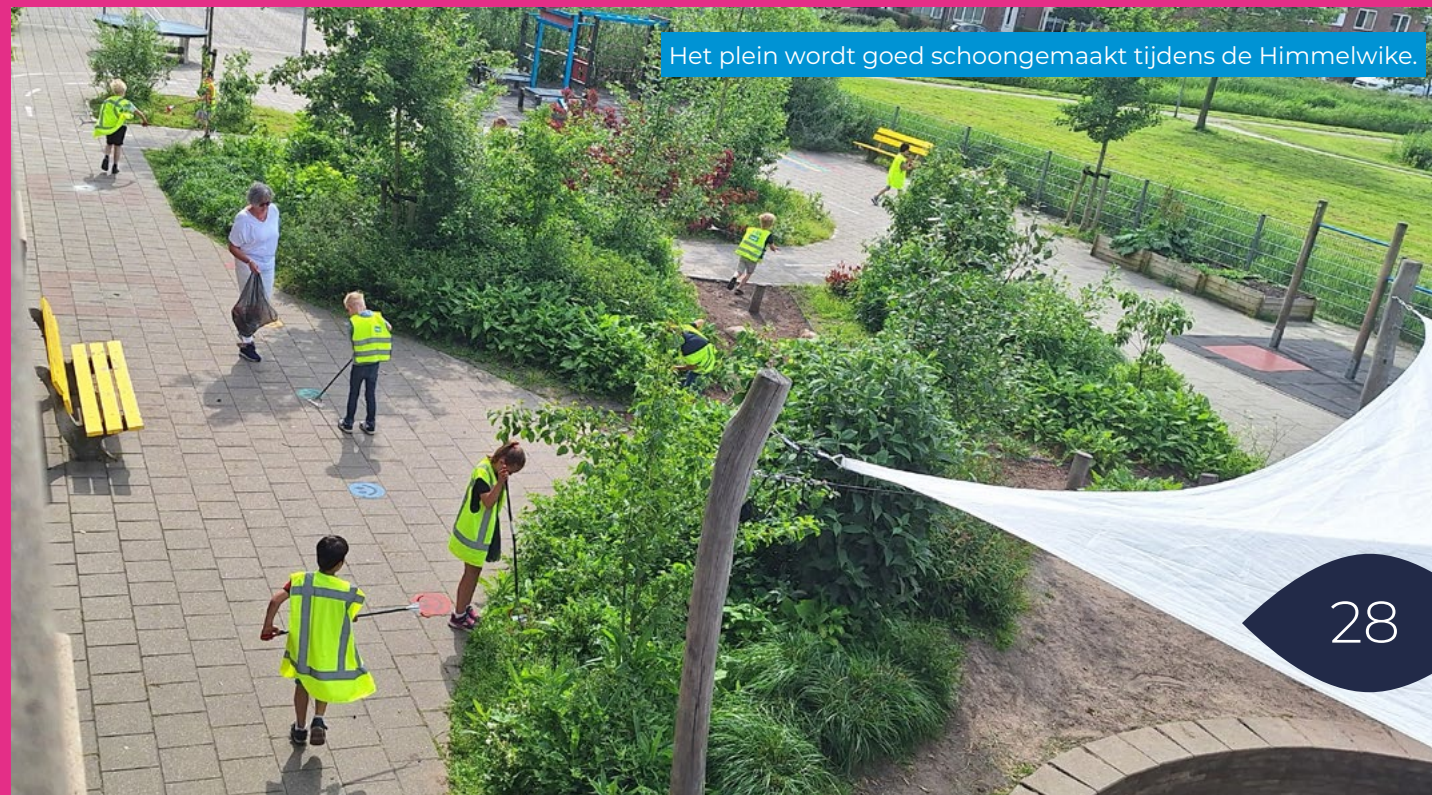
Het plein wordt goed schoongemaakt tijdens de Himmelmwike.