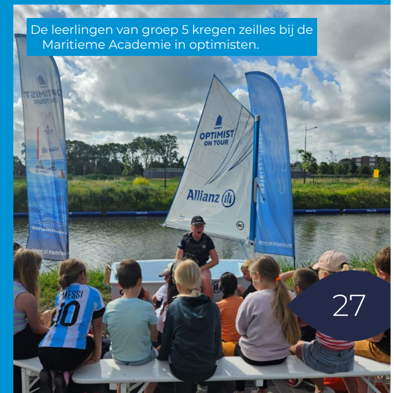
De leerlingen van groep 5 kregen zeilles bij de Maritieme Academie in optimisten.

De OV heeft twee werkgroepen: de versiercommissie en de luizenmoeders. Deze werkgroepen worden gecoördineerd vanuit de oudervereniging. De versiercommissie zorgt steeds voor een mooi versierde school, passend bij de festiviteit van dat moment (bijvoorbeeld Sinterklaas of Kerst) of bij het seizoen (herfst, winter, lente, zomer). De luizencontrole vindt steeds plaats vóór en ná elke vakantie. De oudervereniging vergadert gemiddeld één keer per maand. Heb je belangstelling om lid te worden of wil je een keer een vergadering bijwonen? Dat kan. Je kunt een e-mail sturen naar administratie.hetnoorderlicht@kykscholen.nl