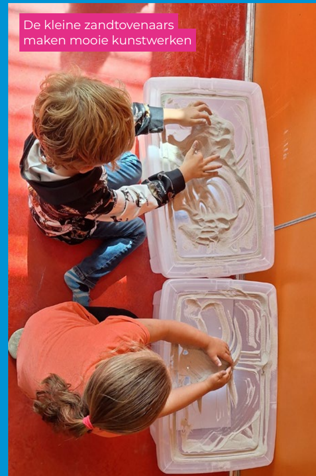
De kleine zandtovenaars maken mooie kunstwerken