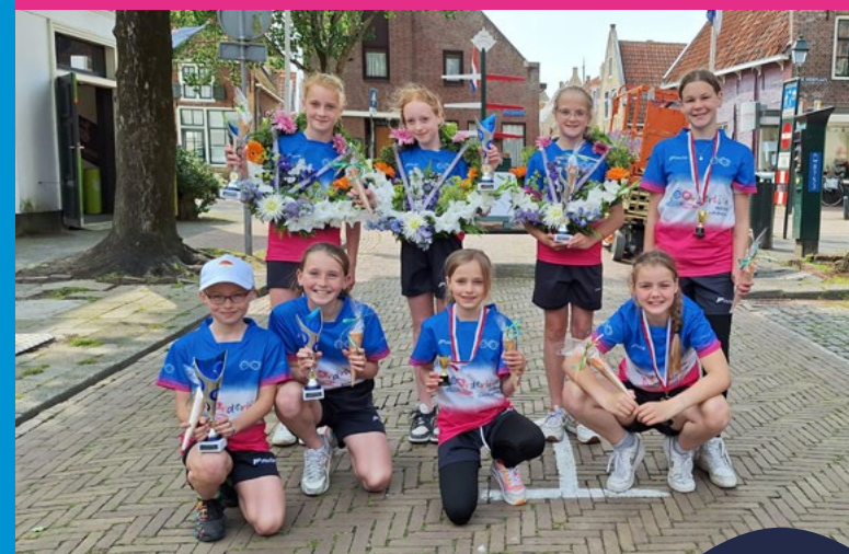
De prijswinnende parturen van het Lanenkaatsen 2024.

Via de medezeggenschapsraad (MR) kunnen ouders hun mening geven over alles wat de school aangaat. In de raad zitten ouders en teamleden. De MR-leden worden gekozen via verkiezingen. De directeur van het Noorderlicht is geen lid, maar op uitnodiging aanwezig bij de vergaderingen. De MR vertegenwoordigt personeelsleden en ouders en behartigt hun belangen. De MR praat en denkt mee met het schoolbestuur over de inhoud en de uitvoering van het onderwijs op school. De vergaderingen zijn openbaar. Ouders, die graag aanwezig willen zijn, kunnen dit vooraf aangeven bij de voorzitter. Een ouder of een teamlid van ikc het Noorderlicht kan ook vertegenwoordigd zijn in de gemeenschappelijke medezeggenschapsraad (GMR) van alle KyKscholen. Heeft u vragen, tips of ideeën? Laat het weten aan de medezeggenschapsraad. Uw stem wordt gehoord! Meer informatie over de MR en GMR staat op de website.