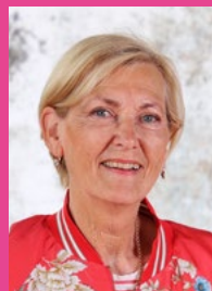
Sippy Hofstra Administratie